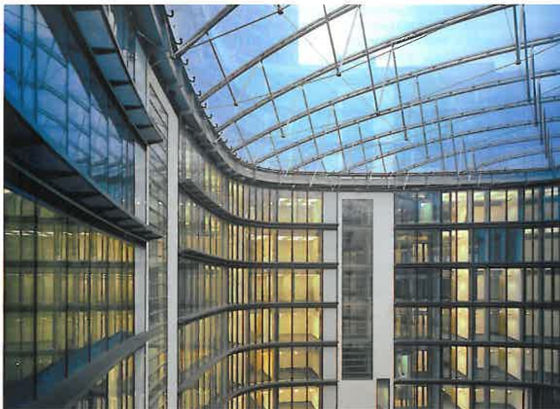
Oval am Baseler Platz in Frankfurt, Tragwerk mit Seilunterspannung

Folien sind kein Allheilmittel für Architekturfragestellungen, sondern bilden nur eine zusätzliche Möglichkeit, um bestimmte Formensprachen der Planer umzusetzen und um technische Problemstellungen auch innerhalb sehr enger wirtschaftlicher Budgets zu bewältigen. Als Entscheidungshilfe für Planer und Investoren kann ein Systemvergleich dienen, der die wesentlichen Eigenschaften von Glas- und Foliensystemen gegenüberstellt. Dabei wird offensichtlich, dass Foliensysteme bei bestimmten Fragestellungen einige Vorteile mit sich bringen, bei anderen Problemstellungen Glas jedoch deutlich das bessere Lösungsspektrum anbietet.