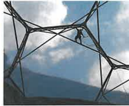
Durchsicht durch 3-lagige Folie