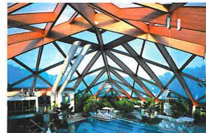
Schwimmbad »Bahia« in Bocholt nach zwölf Jahren ohne Reinigung