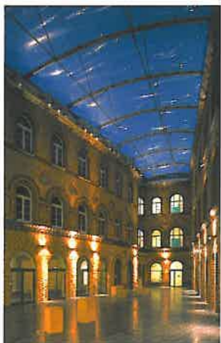
Kapuzinercaaree in Aachen

Glas ist im wahrsten Sinne des Wortes glasklar. Auf Grund des extrem niedrigen Streulichtanteiles erscheinen Konturen durch Glas hindurch absolut scharf und unverfälscht. Folien, insbesondere Mehrlagensysteme, weisen einen größeren Streulichtanteil auf. Konturen sind weniger scharf. Bei der direkten Durchsicht durch Folien sind diese als Hüllfläche in der Regel deutlicher zu erkennen als einzelne Glasscheiben. Auch wenn neuere Entwicklungen der folienproduzierenden Industrie deutliche Verbesserungen erzielt haben, ist gläserne Klarheit mit Folien heute nicht zu erreichen. Die Transparenz für das Sonnenlicht hingegen ist bei ETFE-Folien größer als bei Glas. Insbesondere im Ultraviolettbereich sind ETFE-Folien deutlich transparenter als Standard-Glasprodukte. Diese Eigenschaft hat dazu geführt, dass die ersten und die vielleicht auch bekanntesten Projekte mit ETFE-Folienhüllen Schaugewächshäuser sind, wie zum Beispiel das EDEN Projekt in Cornwall.