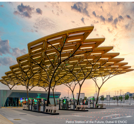
Petrol Station of the Future, Dubai © ENOC