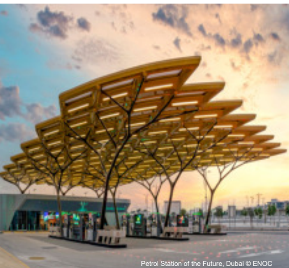
Petrol Station of the Future, Dubai