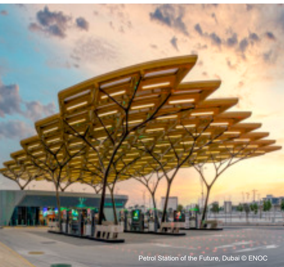
Petrol Station of the Future, Dubai © ENOC